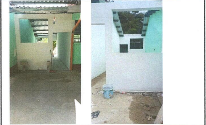
Foto 2: Necesidad de mejora de techo, balcones, piso (entre dos paredes)