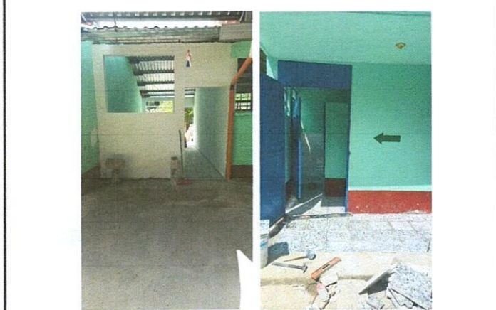
Foto 3: Necesidad de mejora de los servicios sanitarios (relación con depósito de agua, instalación de piso, sanitario y tubería)