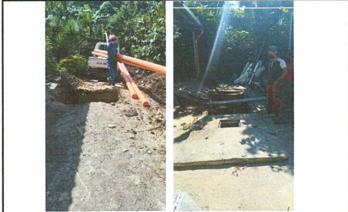
Foto 1: Vista de la necesidad de reparación de planta de tratamiento de aguas grises (sistema de drenaje y depósito de agua entubada)